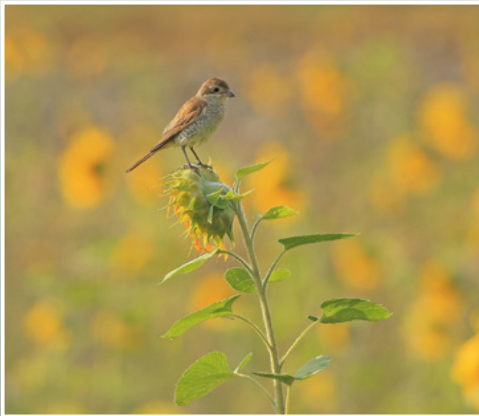
Neuntöter auf Blühfläche

Die Kirschbachwiesen bei Philippstein haben sich im Sinne des Naturschutzes und der Artenvielfalt unter Einfluß der AGNU wundervoll entwickelt. In den trocknen, östlichen Hanglagen herrscht mittlerweile eine begeisternde Insektenvielfalt, die Ihres gleichen sucht. Auch die unteren feuchten Bereiche entwickeln sich gut. Zur Förderung der heimischen Reptilienfauna (Zauneidechse, Blindschleiche, Schlingnatter) werden Stein- und Holzhaufen im Verlauf dieses Jahres angelegt. Ein kleiner Teich soll unterhalb im Gelände entstehen.