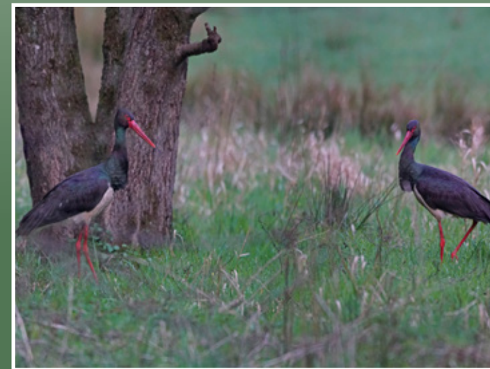
Schwarzstörche im Weipersgrund

Thema: Naturbilder und Plaudereien - Rund um den Naturschutz und die Natur in der Region. AGNU Jahresabschluss mit dem befreundeten Naturschützer und Topnaturfotografen Helmut Weller Treffpunkt: Café Tiergarten Braunfels (Tiergartenstraße hinauf bis zum Parkplatz am Café), Großer Saal Leitung: Helmut Weller