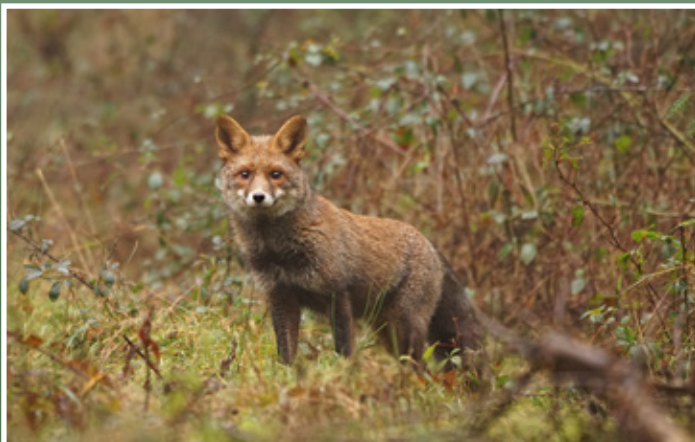
Fuchs in der Kirschbach in Philippstein

Die Kirschbachwiesen bei Philippstein haben sich im Sinne des Naturschutzes und der Artenvielfalt unter Einfluß der AGNU wundervoll entwickelt. In den trocknen, östlichen Hanglagen herrscht mittlerweile eine begeisternde Insektenvielfalt, die Ihres gleichen sucht. Auch die unteren feuchten Bereiche entwickeln sich gut. Zur Förderung der heimischen Reptilienfauna (Zauneidechse, Blindschleiche, Schlingnatter) werden Stein- und Holzhaufen im Verlauf dieses Jahres angelegt. Ein kleiner Teich soll unterhalb im Gelände entstehen.