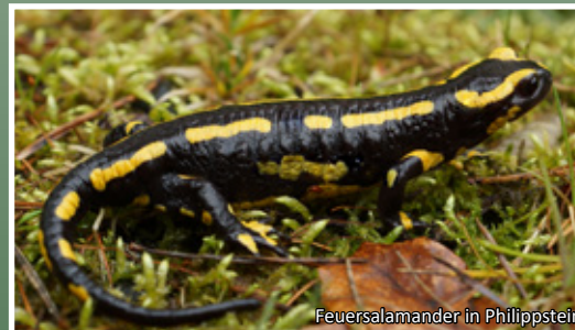
Feuersalamander in Philippstein